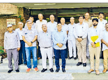
महाराजा सुरजमल शिक्षण संस्थान में कमेटी की बैठक

प्रीत विहार कॉलोनी में भी शनिवार को गणपति विसर्जन धूमधाम से सम्पन्न हुआ। कॉलोनीवासियों ने रंग-बिरंगे जुलूस और भक्ति गीतों के बीच गणपति बप्पा की प्रतिमा को विदा किया। महिलाएं, बच्चे और बुजुर्ग सभी पूरे उत्साह से शामिल हुए। श्रद्धालुओं ने कहा कि गणेश महोत्सव दस दिन तक भक्तिभाव और उत्साह का प्रतीक रहा। इन दिनों में प्रतिदिन पूजन, मजन-कीर्तन और सांस्कृतिक कार्यक्रम आयोजित किए गए। अब बप्पा को विदा करते समय मन भावुक हो जाता है, लेकिन विश्वास है कि अगले वर्ष वे फिर आएंगे और भक्तों के दुख दूर करेंगे।